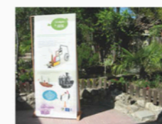
Exposición "La transformación de la Energía".