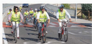
Inauguración del Carril "Bicilínea"