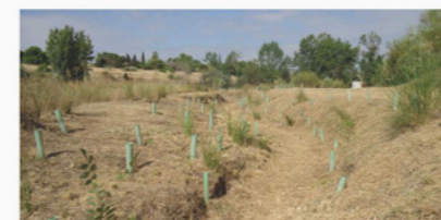
Área La Retoma después de la reforestación.