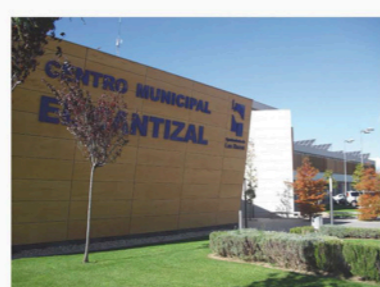
Centro Municipal El Cantizal.