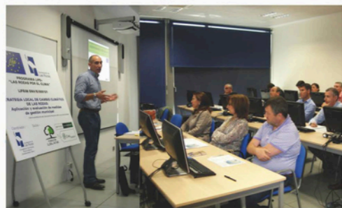
Cursos dirigidos a técnicos del Ayuntamiento de Las Rozas.