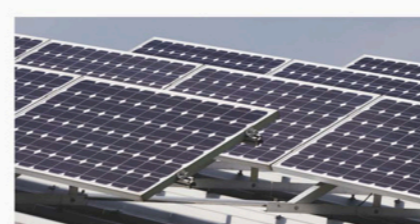
Paneles de Energía Fotovoltaica

Amortización de la instalación: 7,78 años. (18.000 € netos de beneficio anual). Se produce el 15% de la electricidad consumida en el edificio.