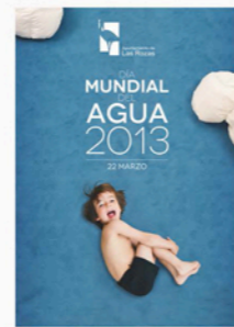
Oficina Municipal para el Desarrollo Sostenible Y la Lucha Contra el Cambio Climático.