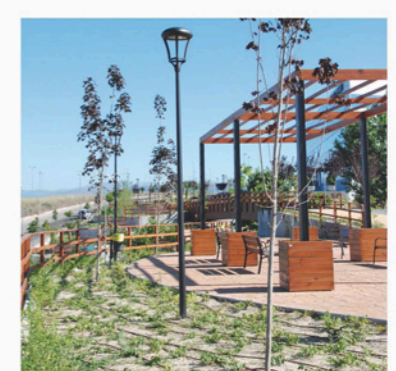
Jardín Sostenible "Los Castillos"

Con el fin de reducir la presión sobre las fuentes de suministro de agua potable para riego de zonas verdes públicas.