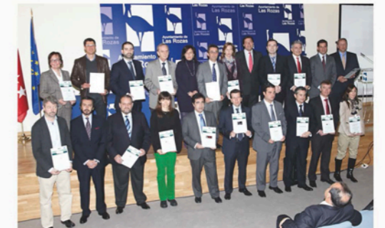
El Alcalde de Las Rozas entrega el Certificado "Crea Medioambiente" a 20 empresas del municipio.