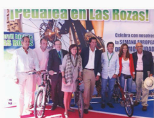
Stand del Ayuntamiento de Las Rozas de Madrid en la Feria Internacional de la Bicicleta.