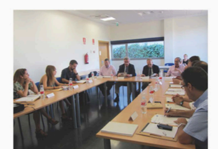
Panel de Expertos reunidos para la redacción de la Estrategia Local de Cambio Climático