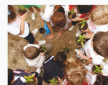
Participantes de EcoEscuelas realizan una reforestación.